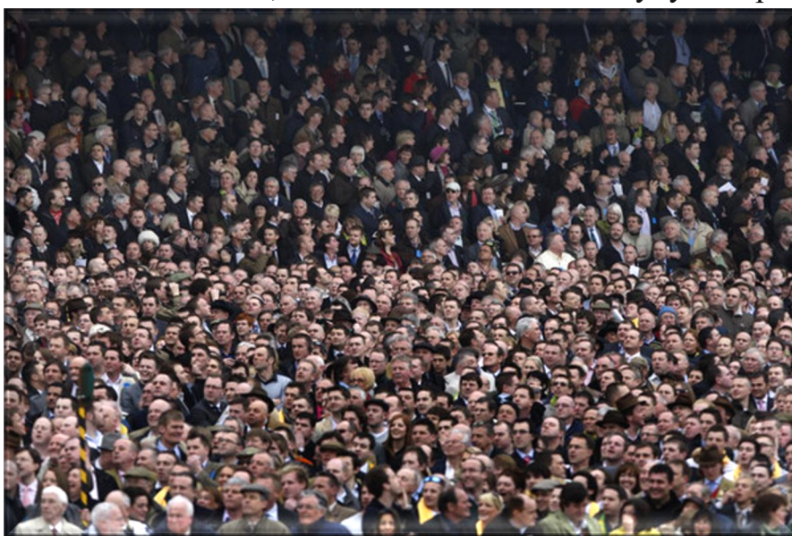
Рис. 2. Сознание определяет бытие

и ориентации простых людей в происходящем и разработки объективных стратегий по выводу из состояния практически уже явной катастрофы. Освещение этих перечисленных проблемных жизненных вопросов через призму ВОССОЗДАННОЙ ИСТИННОСТИ представит всю мрачность реальных состояний развития всех сфер бытия людей, резко отличающуюся от «светлой» лжи о них, декларируемую ныне «управляющей властной сферой», и позволит сделать иные выводы с позиций истинного взгляда на сложившуюся реальность неизбежного краха всех созданных основ бытия людей, выразить основные позиции новой идеологической платформы, РЕАЛЬНО ОЦЕНИТЬ сложившиеся внутренние и внешние причинные обстоятельства, определить и выбрать целесообразные пути и возможно вынужденные экстренные действия, – как последний и решающий шаг по спасению и людей, и самостоятельности в будущем развитии России.