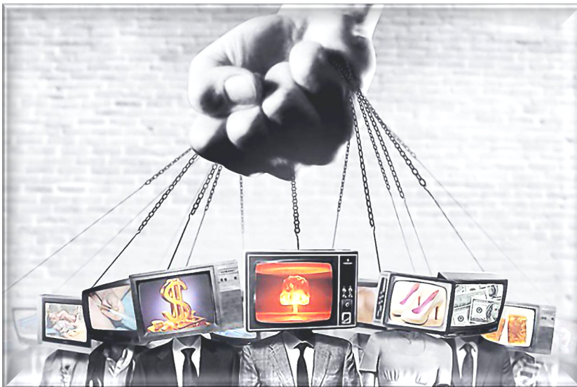
Рис. 1. Держим связь с народом

Связи властных структур и социальных слоёв населения держатся на очень тонких нитях. И эта ткань общества на глазах как будто расплывается. Во главе угла происходящего – насилие и игнорирование чаяний людей. Власть с народом советоваться не хочет предполагая, что видимо и так сойдет. Президент даёт денег медикам за работу на опасных для здоровья условиях, а на местах делают всё, чтоб их не давать. Как могут эти холопы получать больше, чем мы! И так везде: руководители всех уровней уже привыкли без зазрения совести унижать подчинённых морально и материально, принимая такое положение дел, как совершенно нормальное и естественное. Да и трудовое законодательство этому только способствует. Среди молодых людей уровень недоверия действующей власти и готовности к протестным действиям находятся на очень высоком уровне, как бы кто, и что не говорил. Все усилия власти по стабилизации экономики и управления идут прахом. По большому счёту теряется управляемость страной. Большая часть вопросов, решаемая президентом, вид которого на экранах телевизоров последнее время тоже порождает немало вопросов, может быть решена чиновниками на местах, но они ДАЖЕ НЕ ДУМАЮТ об этом.