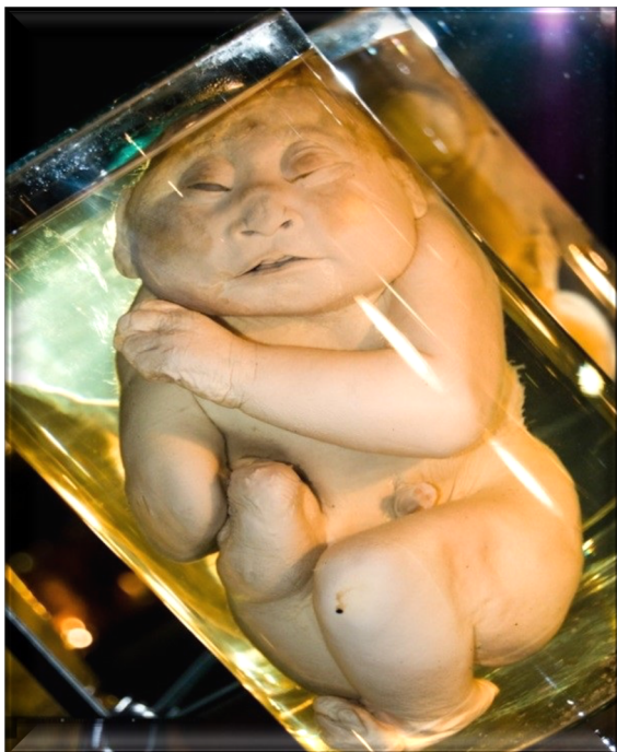
Рис. 4. Необычные люди мира

Весь этот комплексный процесс сопровождающего управления ныне ликвидирован, остались АВТОМОТОРНЫЕ ИНЕРТНЫЕ ЗАТУХАЮЩИЕ навыки самовырождающегося неуправляемого извне бытия, как бывшего целостного комплекса ранее управляемых состояний, незримых людьми. Это является достаточно опасным состоянием на какое-то короткое время, особенно в Переходный период, если этому не придать иное сопровождающее управление. В случае отсутствия управляемости общими процессами бытия вообще, а также при не удержании энергетической гармонии всей окружающей среды, самого проблемного вопроса существования прежней «разумной жизни на Земле» не может быть как такового, поскольку неорганизованное бытие способно ликвидировать себя на протяжении 3÷4 поколений людей! Сработают все ранее обретенные ими разрушительные пороки, как «пиропатроны» на самоликвидацию. В первую очередь, существенную роль в этом разрушении, сыграет общая деградация мозга. И этого допустить нельзя, хотя в сегодняшних реалиях эта деградация уже видна «не вооруженным глазом» у так называемой «правлящей элиты». И на вопрос – «так что же происходит с нашими правителями, они что – все с ума посходили», есть только один ответ: без информационного сопровождения со стороны прежних Управляющих Комплексов большинство установленных ранее функций у индивидов 42, 44 и 46 генотипов мозга не могут обладать активным исполнительским состоянием. Осознание ими окружающей «объективной» действительности без информационного сопровождения