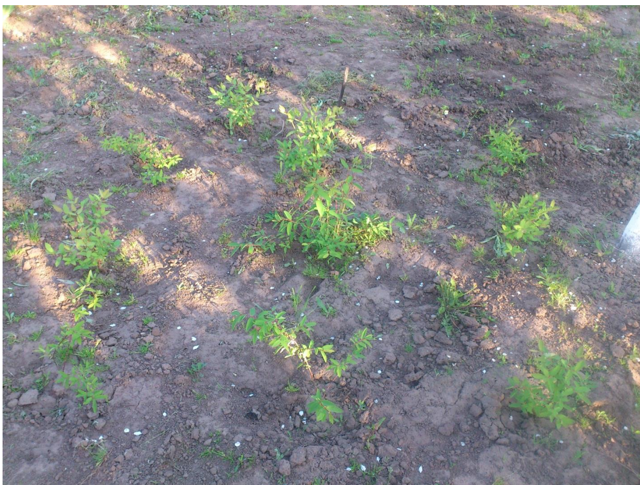
Общая фотография саженцев жимолости.