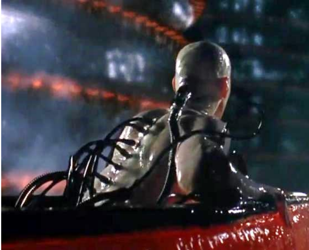
Иллюстрация 6. Трансляция команд и программ посредством позвоночника.

Только в завершающей фазе эксперимента Интервенты вывели генотип, способный принимать команды от Управляющих Комплексов без терминалов (правильно посаженные церкви, мечети и т.п. сооружения массового скопления людей) прямо в Мозг. До этого приёмником кодированных сигналов у всех являлся, и сейчас является – позвоночник.