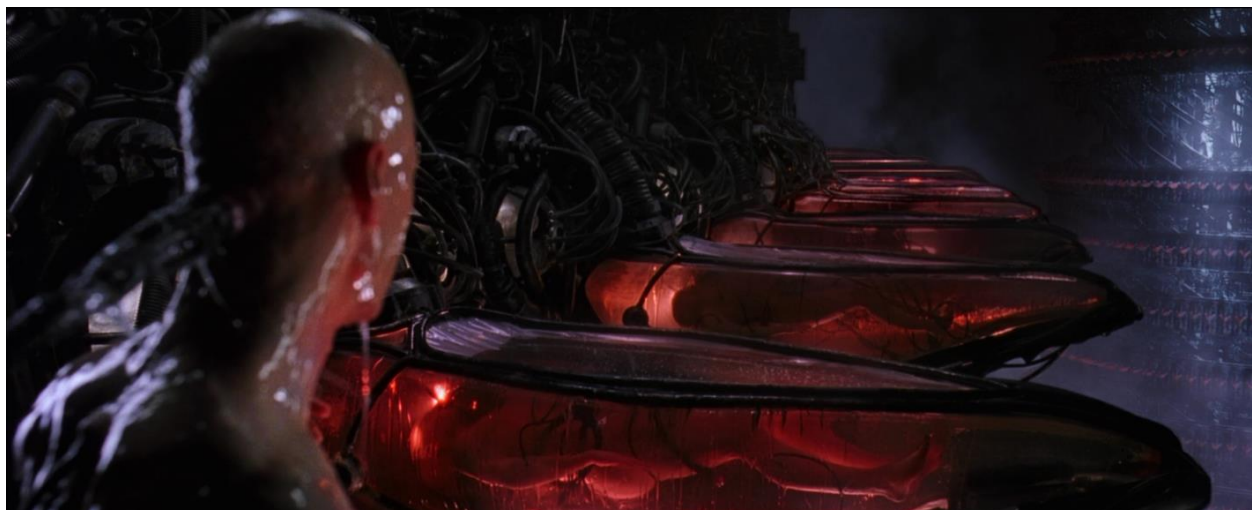
Иллюстрация 2. Управление воплощением пленённых сущностей осуществлялось через Управляющий Комплекс "Кайлас", где они и хранились.

Человек-первоначальный, как таковой на планете Земля, перестал существовать в своём прото облики. И он стал выглядеть так, как выглядит сейчас, будучи изменённым Эбрами практически «от и до».