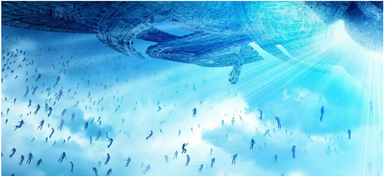
Иллюстрация 1. Пленение Объектом Интервенсткой Системы протосуцностей с 96-124 октавой Мозга

При чтении статьи из Сборника «Знания от На_Чала», у меня возникли следующие размышления, которыми мне захотелось поделиться с теми, кто интересуется Основами Формирования Человечества и той информацией, которая дается нам для понимания происходящих процессов. Буду искренне рад обсудить мои мысли с соратниками.