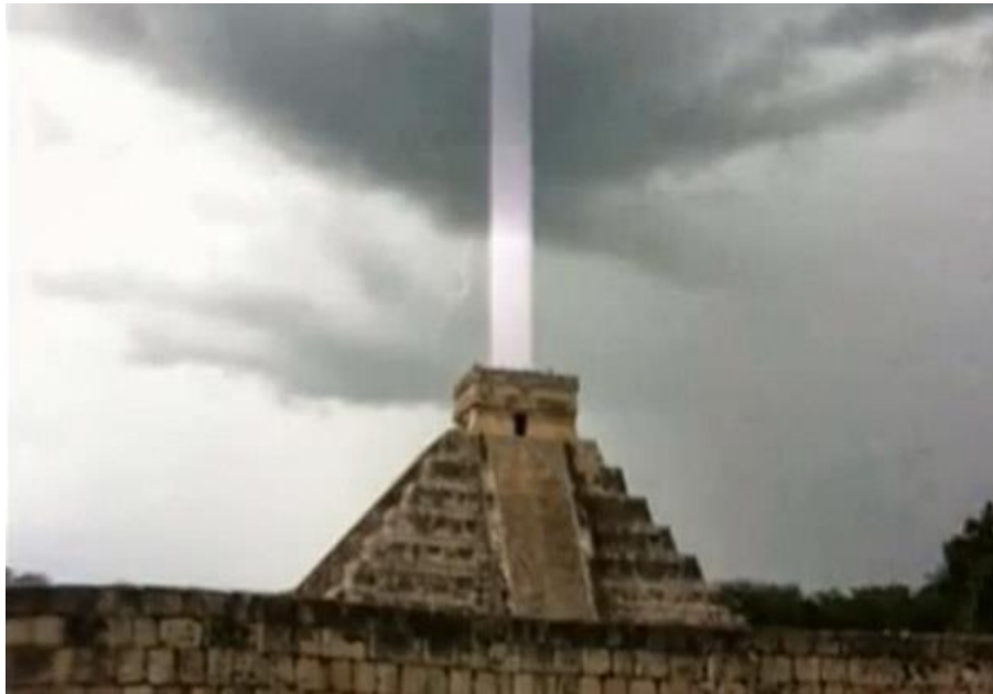
Иллюстрация 5. Через Комплексы Управления транслировались необходимые команды, и создавалось программно-заданное информационное пространство.

Каждой группе генотипов вменялись свои программные требования и шаблоны поведения.