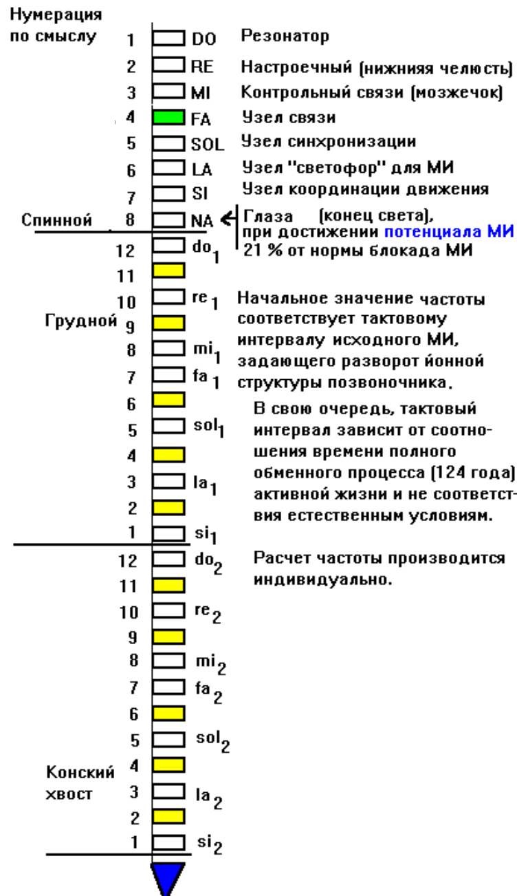
Иллюстрация 7. Кодирование информации при помощи музыкального ряда

Можно было бы осуществлять трансляцию и сразу в Мозг, но тогда Экспериментатором пришлось бы изначально оставить людям Мозг с «высокими» октавами, а не оципать его до 32-ой, и затем наращивать по своим программам, пародийно соответствующих Разуменно ориентированными. Но, в таком случае, это сделало бы людей неуправляемыми для Эбров, и невозможно было бы осуществить весь этот inferнальный умопомрачительный эксперимент.