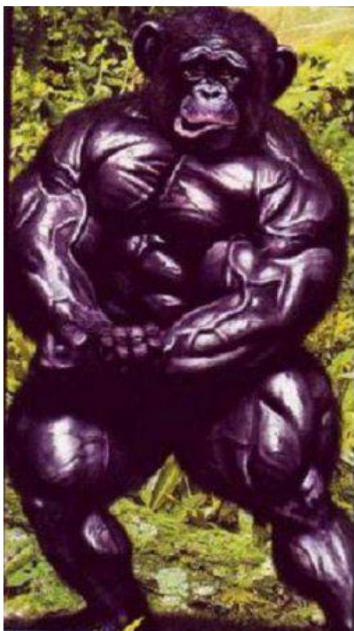
Бодибилдинг превратил обезьяну в человека.

Если личность способна только брать, а не созидать и не восполнять или не ликвидировать последствия от своего содеянного – она не может быть определена как Человек. Это даже не личность, а управляемое биологическое существо.